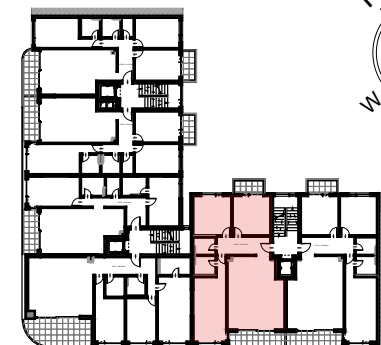
Разположение в сградата